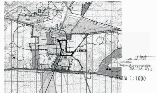
WYRYS ZE STUDIUM UWARUNKOWAŃ I KIERUNKÓW ZAGOSPODAROWANIA PRZESTRZENNEGO