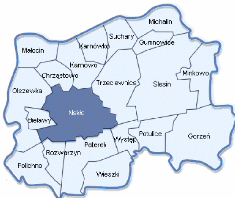
RYSUNEK 2. Gmina Nakło nad Notecią – podział na sołectwa

Gmina Nakło nad Notecią posiada status gminy miejsko-wiejskiej. Sieć osadnicza gminy obejmuje 30 miejscowości skupionych w 20 sołectwach, oraz miasto Nakło nad Notecią. W 2007 roku miasto zamieszkiwane było przez 19 824 osoby, natomiast obszar wiejski gminy liczył 12 974 mieszkańców.