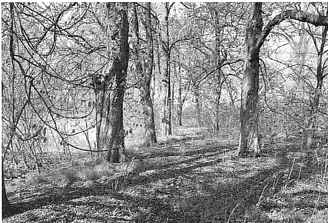
Rys. 3 Aleja drzew biegnąca wokół stawu dworskiego w parku w Gumnowicach

Byłbym szczęśliwy, ażeby spełniły się nasze marzenia.