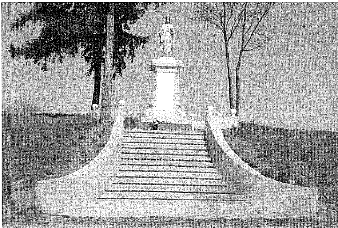
Rys. 2 Figura Chrystusa Króla w Gumnowicach

Na terenie naszej wsi znajduje się figura Chrystusa Króla, którą postawiono i poświęcono w 1927 roku w parku, który jest pozostałością po dawnych włościach.