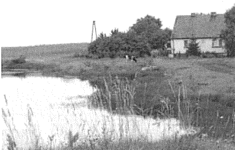
Rys. 1 Jedno z gospodarstw wiejskich w Gumnowicach

Naszą wieś wyróżnia rzetelność, pracowitość mieszkańców, dbałość społeczeństwa o swoje obojętne, szczególnie o porządek wokół gospodarstw i o swoje środowisko naturalne. W ostatnich latach założono wiele trawników, nasadzono drzewa i krzewy ozdobne.