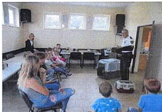
Pogadanki z dziećmi w Gumnowicach

Podczas zajęć lekcyjnych prowadzonych o tematyce ruchu drogowego uczniowie otrzymali zawieszki oraz smycze odblaskowe. Przedmioty te zostały zakupione ze środków własnych Straży Miejskiej oraz Gminnej Komisji Rozwiązywania Problemów Alkoholowych w Nakle nad Notecią. Ponadto w celu zapewnienia ładu i porządku publicznego strażnicy miejscy wykonują patrole piesze lub zmotoryzowane terenu szkół oraz ulic do nich przyległych zwracając uwagę między innymi na zachowanie uczniów korzystających z oznakowanych przejść dla pieszych. W roku 2018 wykonano 441 takich patroli.